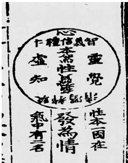
退溪先生心性情圖