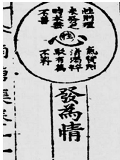
栗谷先生心性情圖

權尚夏過世之後，家人將書篋遺稿寄予韓元震，韓元震檢視之餘，以為李東將流布其說法，恐有傷老師盛名，因此決意違反權尚夏“且戒小子以無辯”的指示，逐條批駁，撰成《李公舉上師門書辨》，回應“湖洛論爭”相歧論點，云：